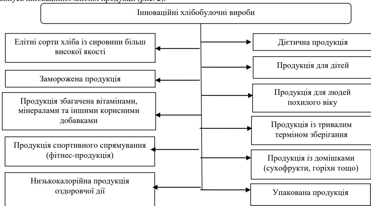
Рис. 2. Основні напрямки інновацій в хлібопекарській галузі України

Результати досліджень свідчать, що найбільшу питому вагу у вітчизняному хлібопеченні займають пшеничний (близько 38,6%) та житній (близько 30,3%) хліби. Булочні вироби формують близько 21% ринку хлібопродуктів, решту 4,9% в асортиментному ряді складають здобні хлібобулочні та бубличні вироби, грінки, сухарі, пиріжки, пончики, пряники, печиво тощо. Крім традиційних виробів, в Україні важливим є випуск інноваційної хлібної продукції (рис. 2).