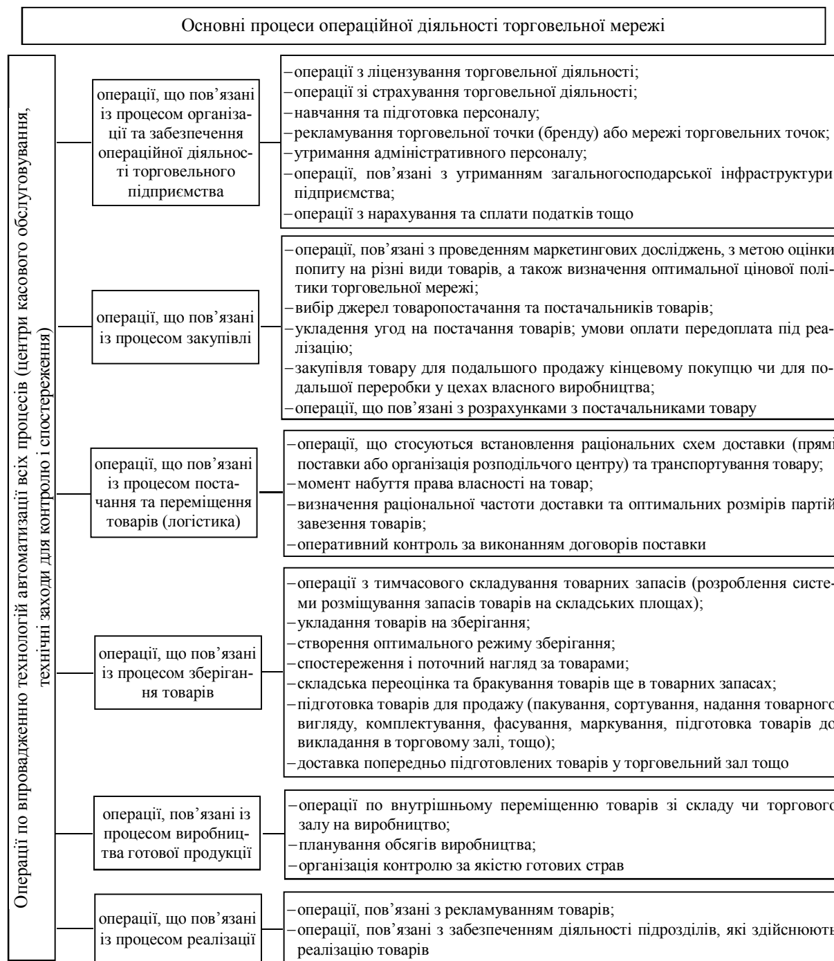
Рис. Основні процеси операційної діяльності торговельної мережі

Розвиток торговельних мереж – явище позитивне для споживачів і дуже серйозне випробування для виробників, оскільки у міру захвату частки ринку торговельні мережі набувають все більшого впливу на постачальників. Виробники, які звикли самі диктувати вимоги до торгівлі, змушені переглядати свої принципи роботи у процесі співпраці з торговельними мережами. Перш за все, виробники змушені постачати свою продукцію в торговельні мережі за мінімальними цінами, переглядати дисконтну політику. З другого боку, низькі відпускні ціни виробника можна розглядати як плату за право мати гарантовано високий збут через торговельну мережу. У більшості випадків ця плата виправдовується, оскільки великі обсяги реалізації, що забезпечує торговельна мережа, перекривають недоотриманий прибуток від зниженої відпускної ціни. В деяких торго-