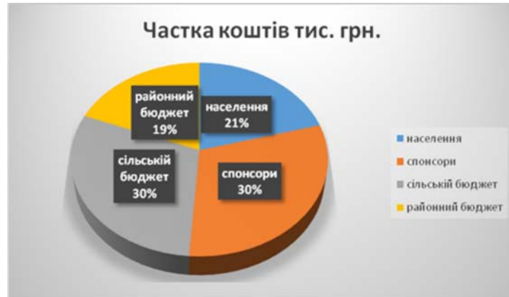
Рис. 1. Частка коштів Ямпільського району Вінницької області у реалізації проектів ЄС/ПРООН «МРГ» у 2014-2016 рр.

Перед тим, як запускати механізм соціальної мобілізації, необхідно вивчити основні проблеми регіону (території) при спілкуванні з громадськістю та проаналізувати ресурсний потенціал. Як приклад, можна розглянути Ямпільський район Вінницької області, основне місце в економіці якого займає агропромисловий комплекс (85% за 2015 рік). Район не є газифікованим, та пріоритетним є розвиток сільського господарства (виробництво зерна, цукрових буряків, молока та м'яса). Із переваг району можна виділити родючі ґрунти, великі об'єми сільськогосподарських угідь та вихід до державного кордону Республіки Молдова. Зважаючи на складну економічну ситуацію, відсутність достатньої кількості робочих місць, район з 2014 року приймає активну участь у проекті ЄС/ПРООН «Місцевий розвиток, орієнтований на громаду». За два роки район спільно з громадами надав співфінансування в розмірі 795,5 тис. грн., а це 10,2 % в тому числі населення 164,6 тис. грн., спонсори 242,4 тис. грн., сільський бюджет 237,5 тис. грн., районний бюджет 151,0 тис. грн., (8,8% коштів співфінансування, які було перераховано головним розпорядникам коштів) (рис. 1.). Реалізовано безліч проектів, це і ремонт шкіл, дитячих садочків, установлення сонячних колекторів, і навіть відкриття готелю «Дністер», який приймає переселенців із зони АТО та Криму.