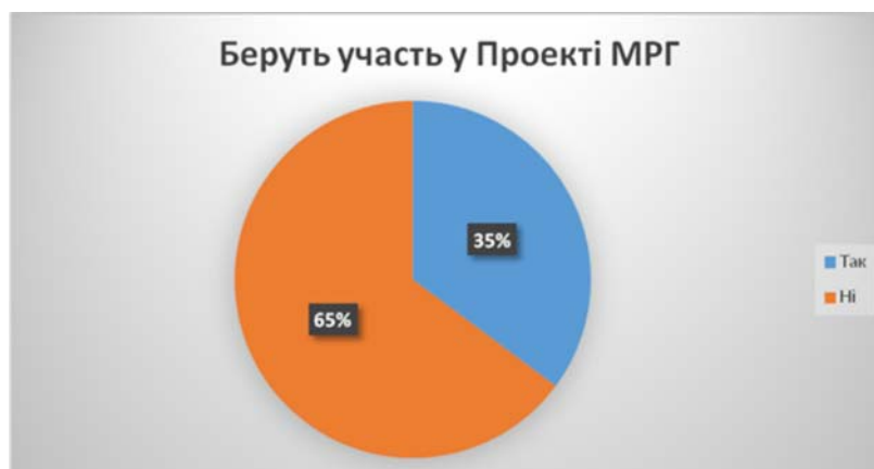
Рис. 3. Участь населення у проекті ЄС/ПРООН «Місцевий розвиток орієнтований на громаду»

Із тих, хто знає про проект, 35% приймають участь або допомагають у його реалізації (рис. 3).