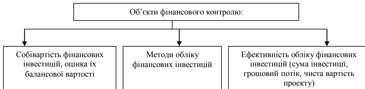
Рис. 2. Об'єкти державного фінансового контролю іноземних інвестицій

Підчас проведення інспектування (ревізій) перевіряючий використовує наступні методичні прийоми: інвентаризація; контрольні заміри; експертиза; розрахунково-аналітичні методи; документальний контроль; методи зустрічної перевірки; методи визначення якісних показників інвентаризаційних планів; контроль довгострокових фінансових інвестицій.