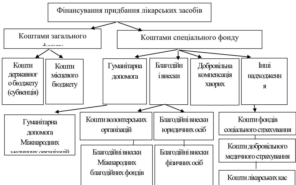
Рис. 1 Джерела фінансування придбання комунальними неприбутковими закладами лікарських засобів

Основні джерела фінансування придбання комунальними неприбутковими закладами лікарських засобів зображені на рис. 1.