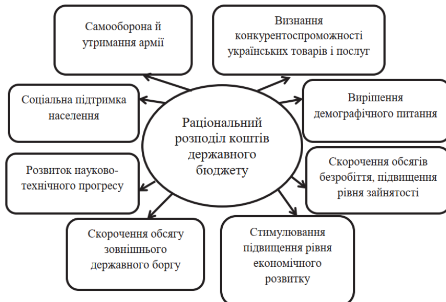
Рис. 2. Явища, залежні від формування державного бюджету

На сучасному етапі розвитку України розроблення та впровадження дієвого механізму забезпечення бюджетної безпеки є пріоритетним завданням, вирішення якого стане гарантією прогресу вітчизняної економіки, суверенітету країни, її фінансової незалежності, а також забезпечення гідного рівня соціальної підтримки громадян України [6, с. 19].