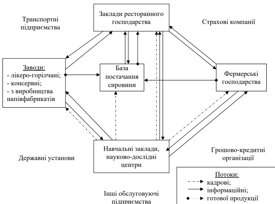
Рис. 2. Механізм взаємодії кластера ресторанного господарства