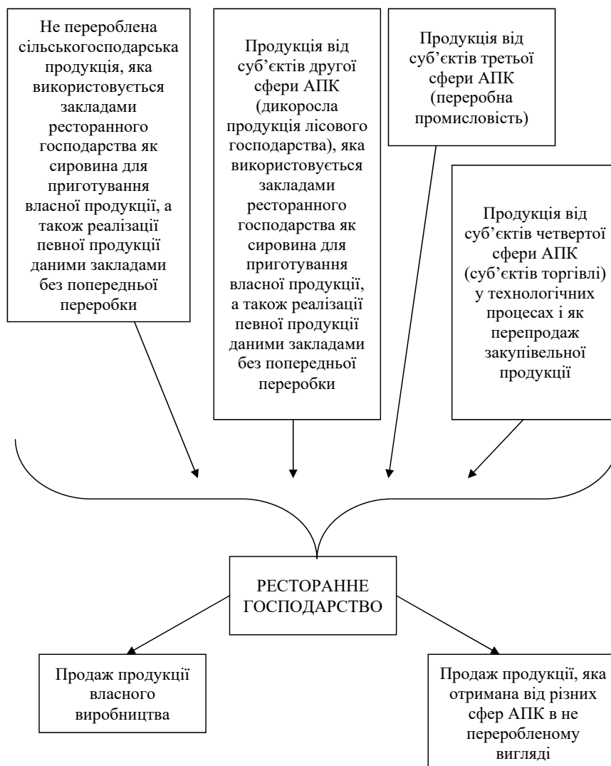
Рис. 1. Класифікація продовольчих продуктів АПК, які реалізуються закладами ресторанного господарства

Для використання переважно вітчизняної продукції для приготування страв у закладах ресторанного господарства варто використовувати замкнутий цикл виробництва, який відбуватиметься під замовлення підприємств ресторанного господарства (рис. 1).