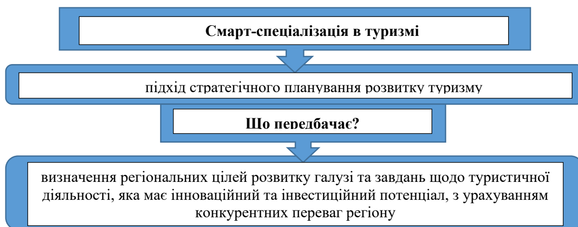
Рисунок 1 – Сутність смарт-спеціалізації туризму регіону