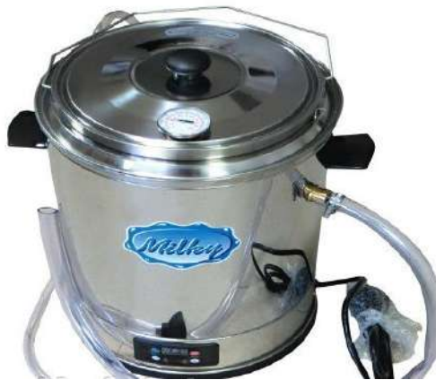
Рисунок 2. Мініпастеризатор-сироварня марки FJ 15

Особливістю внесення бактеріальних заквасок є те, що після високотемпературного оброблення маслянки за режимом (100\pm 5)^\circ\text{C} з витримкою 25 с та проводили охолодження до 30\pm 2^\circ\text{C} . Закваску готували на охолоджену молоці, перемішували протягом 5 хв для рівномірно розподілу складових заквасочних культур. Вносили різне співвідношення основної і додаткової закваски: 1,8 % основної і 0,2 % додаткової. Сквашування проводили до титрованої кислотності не менше 75- 80 °Т (рН=4,7). Далі додавали сухий порошок спіруліни (1уп=20 грам): 1 зразок - 10гр, 2 зразок -15 гр, 3 зразок - 20 гр, 4 - 25 гр). Зразки кисломолочного напою охолоджували і зберігали в умовах холодильної камери при температурі (4\pm 2)^\circ\text{C} не менше 8-ми днів. Після цих технологічних операцій проводили випробування. Змішування проводили міксером. Пастеризацію маслянки здійснювали в сировиробничому котлі марки FJ 15. Розроблено зразки сумішей №1,2,3.