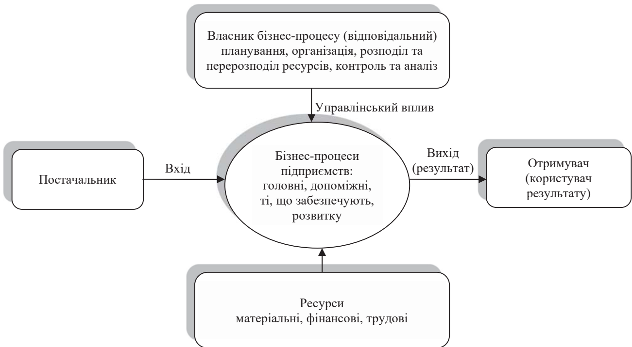
Рис. 1. Схема бізнес-процесу підприємства