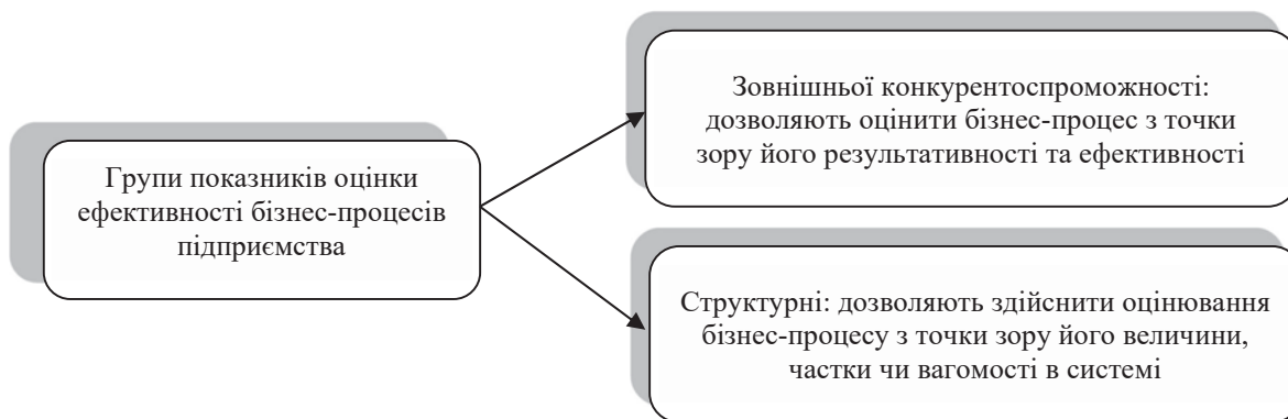
Рис. 3. Методи оцінювання ефективності бізнес-процесів підприємства