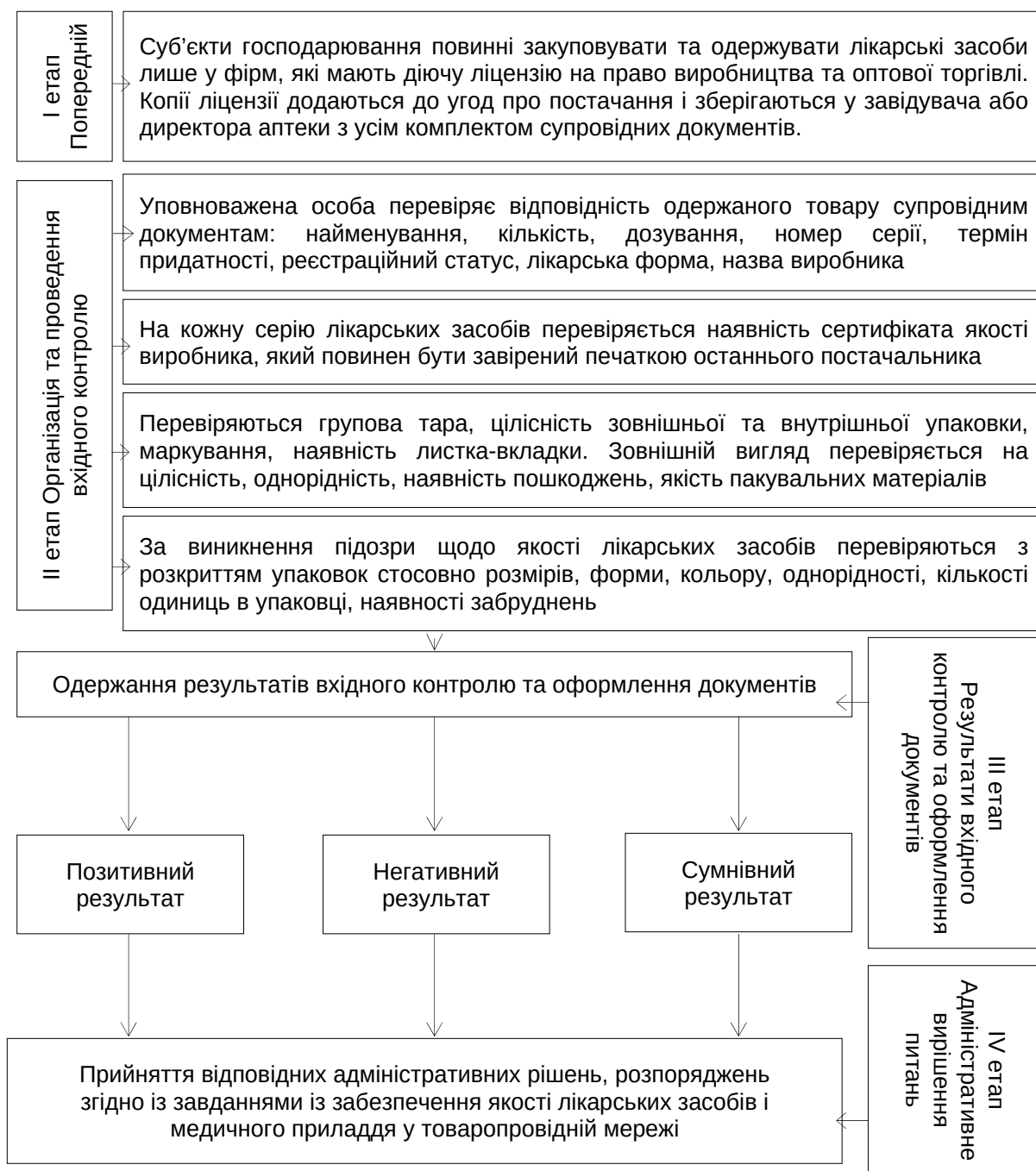
Рис. 3. Алгоритм проведення вхідного контролю якості лікарських засобів

Сьогодення переповнене новітніми технологіями. Для полегшення обліку та контролю на підприємствах фармацевтичної галузі необхідно також провести автоматизацію й удосконалення, аби ефективніше вести діяльність із дотриманням усіх вимог та правил.