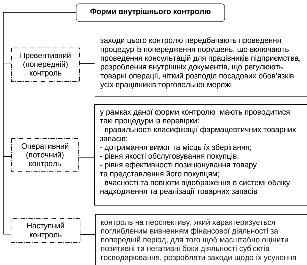
Рис. 2. Форми здійснення внутрішнього контролю

Одним з основних напрямів в управлінні товарними запасами торговельного підприємства є нормування та планування їх розміру. Метою нормування товарних запасів є визначення їх оптимальних розмірів для забезпечення планового обсягу товарообігу, утворення необхідних матеріальних передумов для ритмічного і безперебійного продажу товарів за найменших витрат на їх формування, зберігання, регулювання [5].