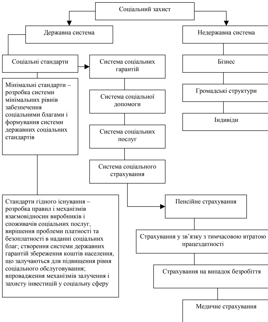
Рис.1 Система соціального захисту в забезпеченні розвитку людського потенціалу

Вагомими принципами соціальної політики є забезпечення відчутних результатів на конкретних етапах соціально-економічного розвитку суспільства з використанням раціональних обсягів видатків, обмеження осіб, які соціально захищаються в суспільстві, особами, які позбавлені можливості самозабезпечення. За умов посилення процесів децентралізації принциповим є розширення кола соціальних проблем, що вирішуються місцевими органами виконавчої влади та місцевого самоврядування при пріоритетності державного підходу із одночасним висвітленням державними органами завдань збереження соціальної згуртованості суспільства; забезпечення державної підтримки підприємництва, зокрема середнього і малого бізнесу [2].