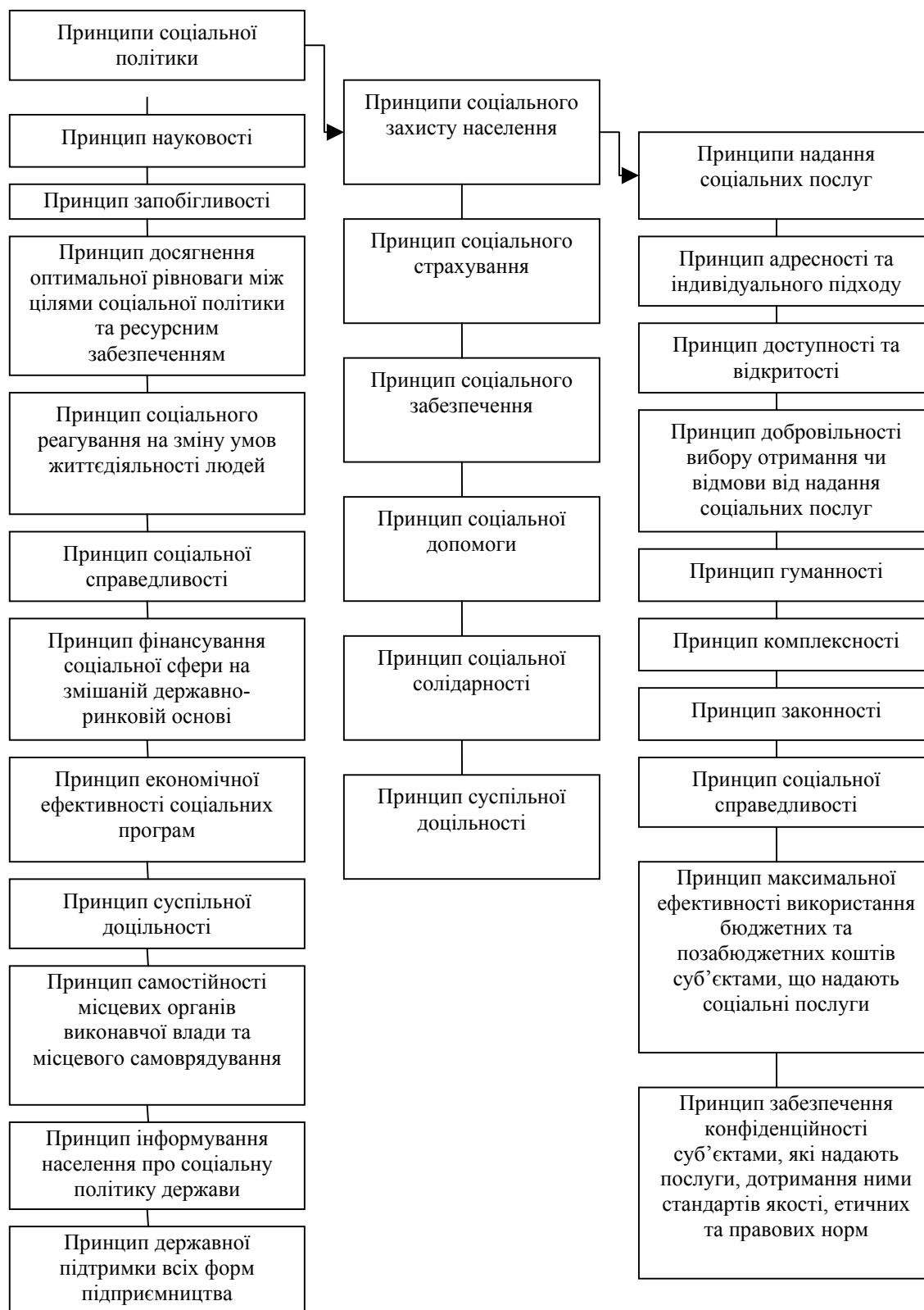
Рис.2 Компонентна ієрархічна схема принципів соціальної політики, соціального захисту та надання соціальних послуг населенню