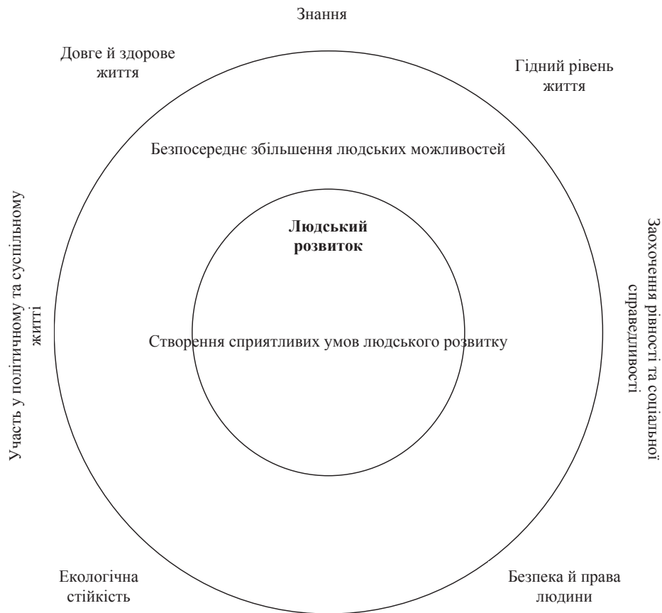
Рис. 1. Основні складові людського розвитку ПРООН

Індекс глобалізації характеризує політичну, соціальну, економічну та технологічну інтегра-