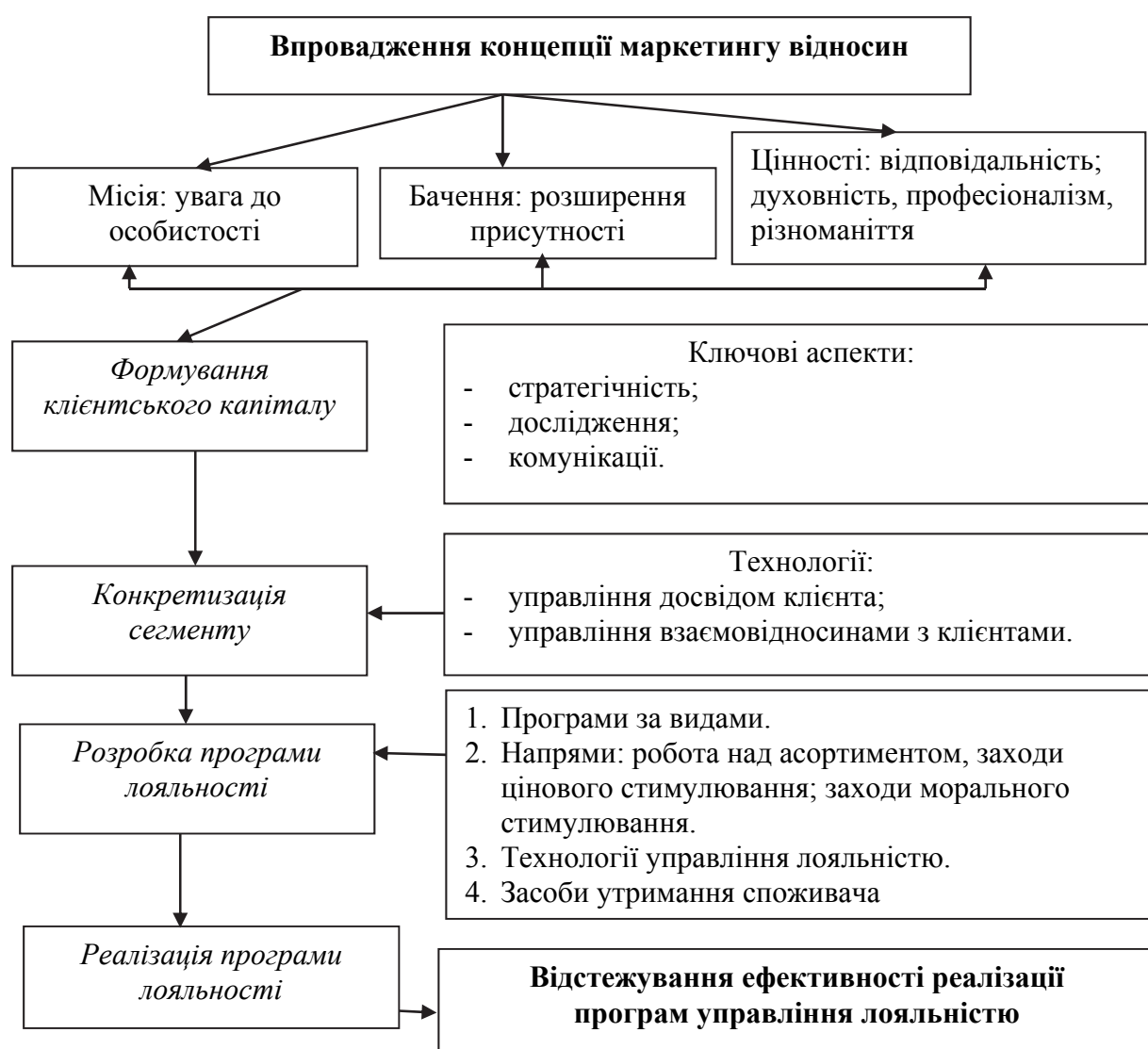
Рис. 1. Алгоритм розробки маркетингової стратегії формування та управління лояльністю споживача

Успішний розвиток підприємств ресторанного бізнесу залежить від розуміння мотивів потенційних споживачів, здатності до професійного аналізу процесу прийняття рішень споживачами ресторанного продукту, усебічне вивчення якого дозволило визначити його як комплекс продукції, матеріально-технічної складової та якісного обслуговування.