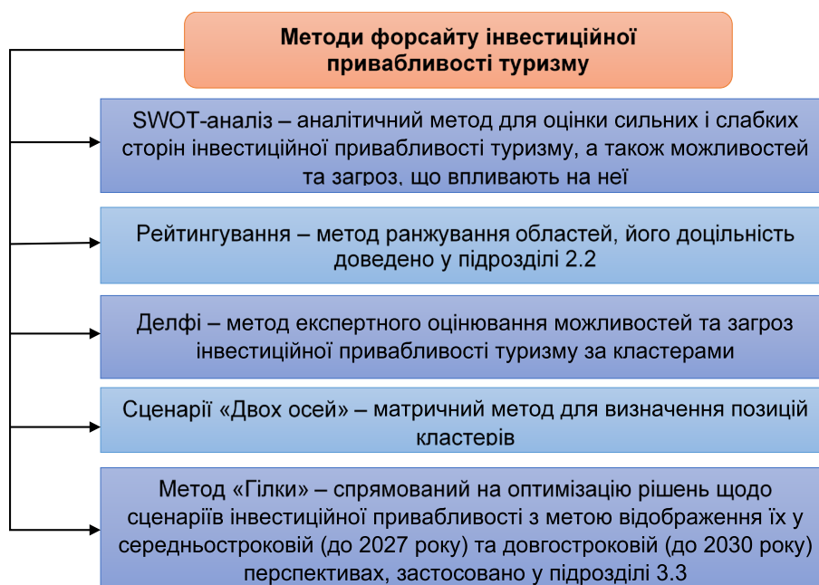
Рис. 2. Методологічні основи форсайту інвестиційної привабливості туризму кластерів