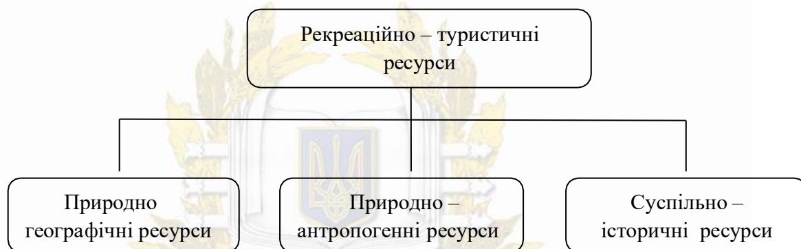
Рисунок 1.1 - Структура рекреаційно – туристичних ресурсів (за О.О. Бейдиком)

характеристики, спосіб використання тощо. Дані ресурси використовуються в оздоровчих, туристичних, спортивних та пізнавальних цілях. З класифікацією рекреаційно – туристичних ресурсів можна ознайомитися, розглянувши рис. 1