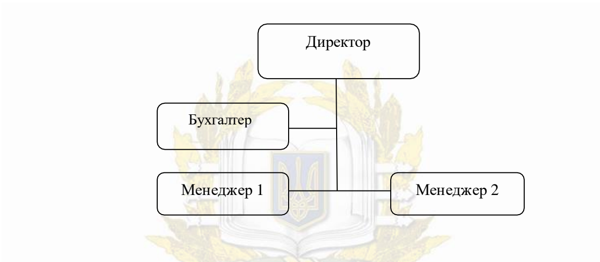
Рисунок 2.3 – Структура туристичної агенції «Світ в кишені»

Структуру можна зобразити у вигляді схеми, яка зображена на Рис 2.3