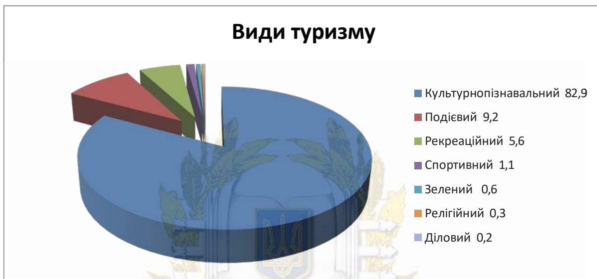
Рисунок 2.2. - Розподіл видів туризму у Вінницькій області [27]

Серед найбільш відомих - музей-садиба знаменитого хірурга М.І. Пирогова та церква-мавзолей, де покоїться його забальзамоване тіло. Цікавими туристсько-екскурсійними об'єктами є залишки скельних храмів – печерний храм VI-VII ст. з унікальними рельєфними композиціями і написами в розколіні скелі над річкою Бушка (с. Буша). Тут збереглися також Вежа, що входила в комплекс укріплень XVII ст., і Покровська церква з келіями (1787 р.).