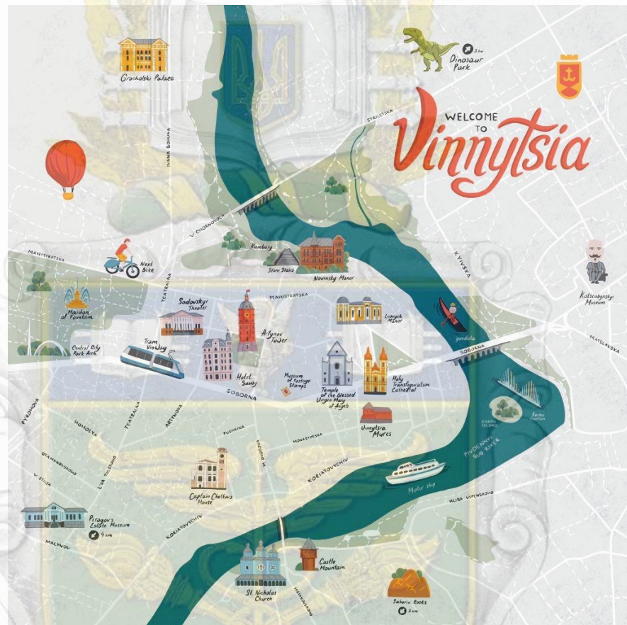
Рисунок 3.3- Стилізована мапа Сергія Мірчука

Про це йдеться на Facebook-сторінці «Visit Vinnytsia». На опублікованій мапі можна розглядити найбільш впізнавані архітектурні об'єкти міста, як то Вежа Артинова, Готель «Савой», Спасо-Преображенський собор, музей Пирогова тощо. Також на мапі розміщені такі туристичні «родзинки» міста, як то Подільський зоопарк на Зулінського чи прогулянки на повітряній кулі.