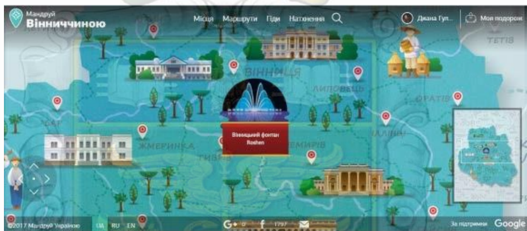
Рисунок 3.2- Локації онлайн -гіду «Мандруй Вінниччиною»

Другий — «Пізнай Вінницю», який відрізняється від першого трьома новими локаціями: музеєм-садибою Пирогова, його церквою-усипальницею та Водонапірною вежею.