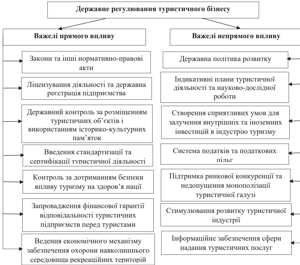
Рисунок 3 – Важелі механізму державного регулювання туризму