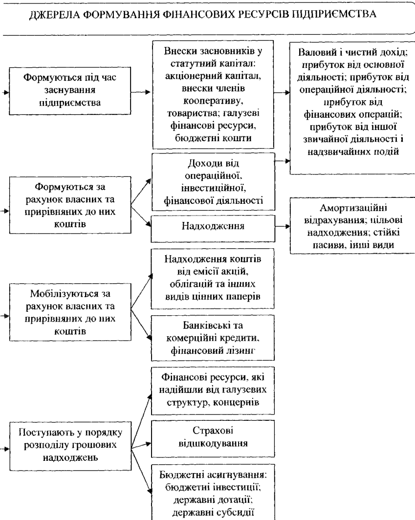
Рисунок 1.3. Класифікація джерел формування фінансових ресурсів [34, с. 59]

Однією з класифікацій фінансових ресурсів підприємства є класифікація в ежності від джерел формування фінансових ресурсів (рис. 1.3).