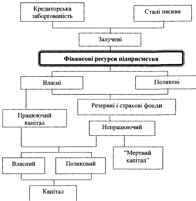
Рисунок 1.1. Взаємозв’язок фінансових ресурсів і капіталу підприємства [97]

Так, капітал є перетвореною формою фінансових ресурсів. Взаємозв’язок фінансових ресурсів і капіталу у загальних рисах відображено на рисунку 1.1.