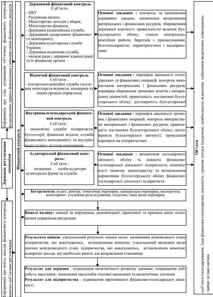
Рис. 2. Система фінансового контролю на рівні суб'єктів господарювання