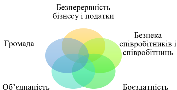
Рисунок 1 – Основні розділи опитування, які були створенні для формування Індексу корпоративної соціальної відповідальності в Україні за 2023 рік [1]

Протягом травня 2023 року експертна організація CSR Ukraine спільно з українським інтернет-виданням The Page провели дослідження, яке присвячене сталості українського бізнесу під час війни. Компанії, що добровільно бажали долучитись до опитування, заповнювали анкету і отримували експертну оцінку своєї сталості. До участі у формуванні Індексу КСВ 2023 долучились 30 компаній. Анкетування базувалось на 5-тикомпонентній моделі КСВ під час війни в Україні (рис. 1). Розглянемо детально зміст кожного компоненту моделі КСВ, наведеного на рисунку: