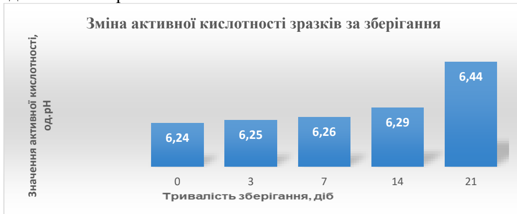
Рис. 1. Зміна активної кислотності зразків за зберігання

Значення рН зразка пастеризованого молока з додаванням екстракту кориці ( Cinnamomum burmannii ), що зберігався впродовж 21 доби (3 тижні), коливалось від 6,24 до 6,44 (рисунок 1), цей діапазон значень лежить в межах стандартних значень: 6,3-6,8. При цьому слід зазначити, що екстракт кориці не змінював значення рН при додаванні. Це показує, що додавання екстракту кориці до пастеризованого молока зберігає якість пастеризованого молока впродовж зберігання. Напевно, це пов'язано з вмістом антибактеріальних речовин екстракту кориці, які здатні пригнічувати ріст бактерій таким чином, що якість молока впродовж до 3 тижнів зберігання залишається стабільною. Середнє значення рН представлено на рис. 1.