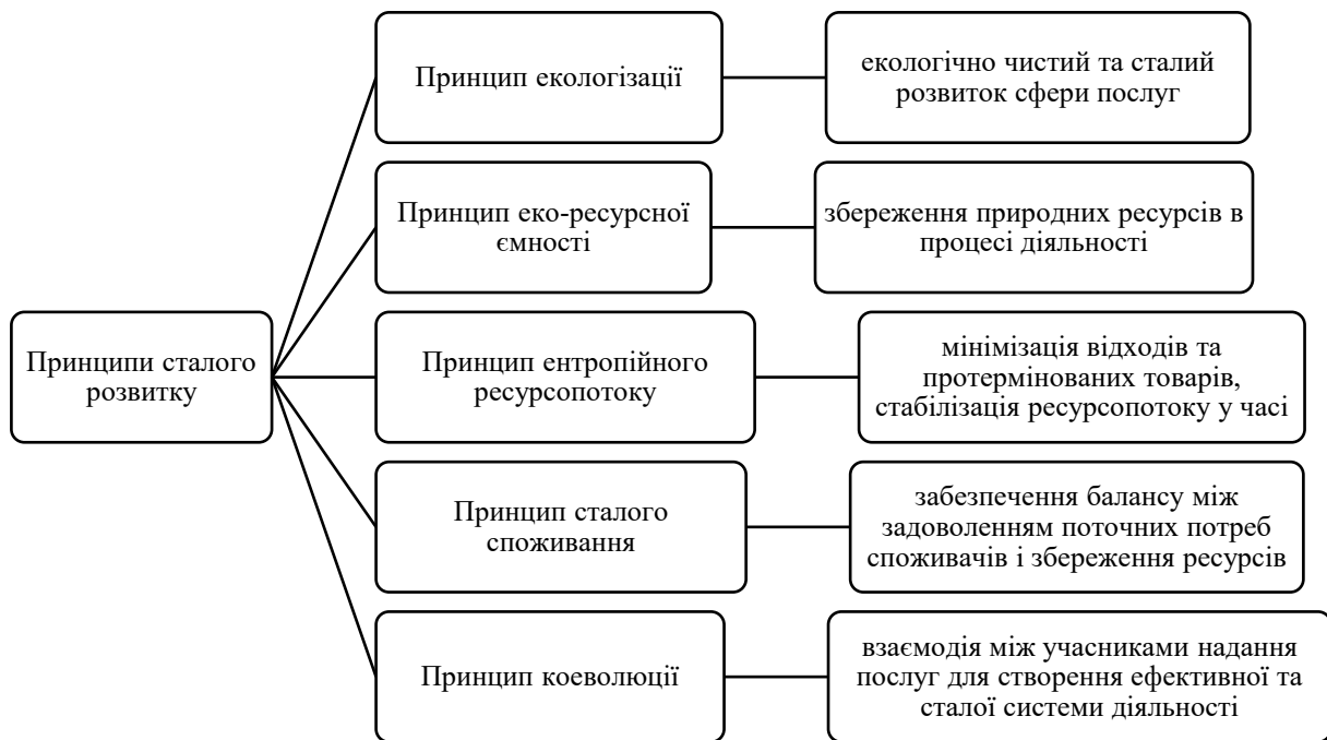
Рис. 2. Напрями застосування принципів сталого розвитку у сфері ресторанного бізнесу

На рис. 2 представлені запропоновані автором напрямки впровадження принципів сталого розвитку у сфері ресторанного господарства.